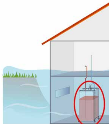
Variante 2: Tankanlage durch Verankerung sichern